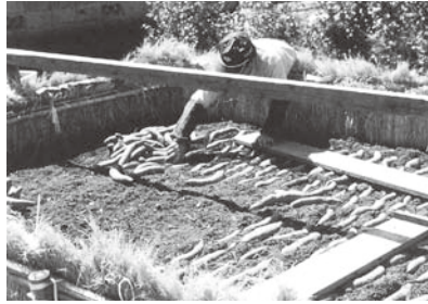
種芋の床伏せ(関東の平地林)

農山漁村から都市の路地裏まで、懐かしい昭和を記録した幻の旅雑誌「あるくみるきく双書」を写真多載し、地方別・テーマ別に再編集。 【第16回配本】 第13巻 関東甲信越③ 栃木・河岸と宿場と問屋商人のまち、甲武国境の山村・西原に食の狩りと暮らし、下肥雑記―町と村をつなぐもの 葛西の肥船 安房の「やわたんまち」―総社の祭と市、関東の平地林、他